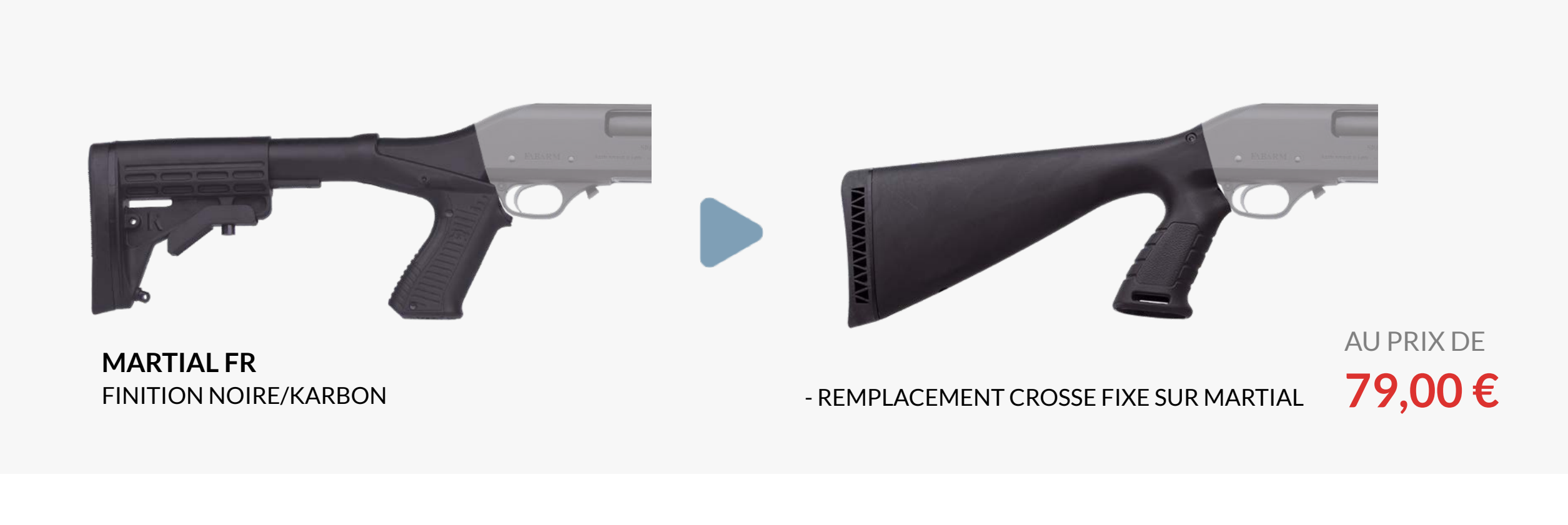
MARTIAL FR FINITION NOIRE/KARBON