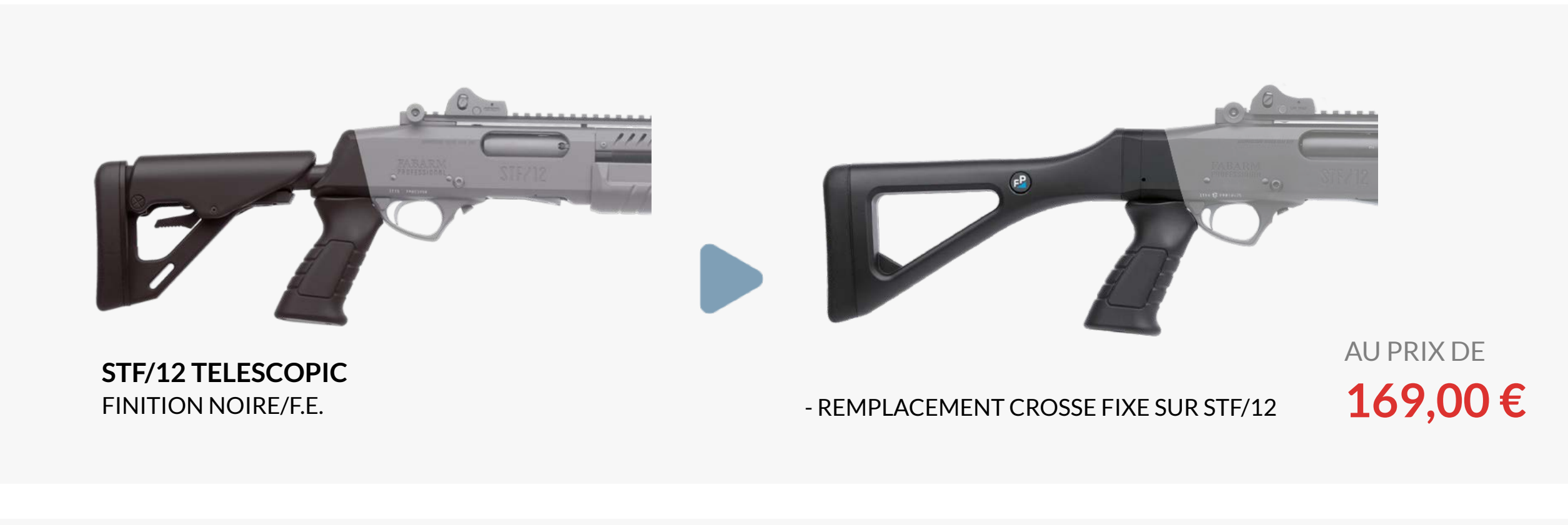
STF/12 TELESCOPIQUE FINITION NOIRE/F.E.

La crosse télescopique démontée vous sera restituée en même temps que votre arme.